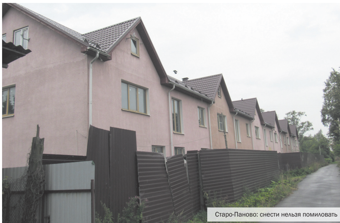
Старо-Паново: снести нельзя помиловать