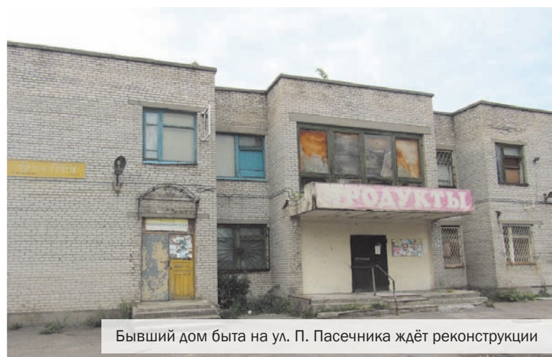
Бывший дом быта на ул. П. Пасечника ждёт реконструкции

В 2017 г. все эти объекты планировалось сдать в эксплуатацию, потом пошла чехарда со сменой подрядчиков, и сроки стали постоянно переноситься. Сегодня, в свете избитого комментария о недобросовестных подрядчиках, в очередной раз прозвучавшего теперь уже из уст самого исполняющего обязанности главы города Александра Беглова, нет смысла называть какие бы то ни было сроки. Всё кажется пустым, а помпезно обещанные к 300-летию Красного Села недострои постепенно превращаются в «заброшки», которые могут развалиться ещё быстрее, чем добротные объекты сталинского ампира в военных городках.