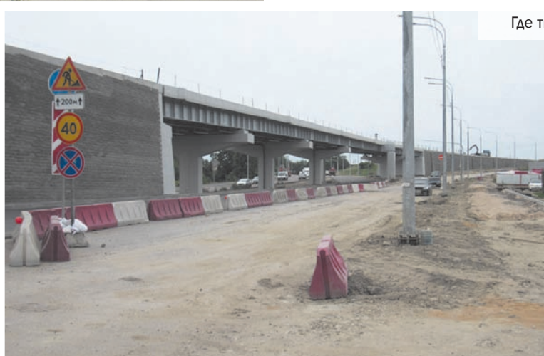
Где ты, Пилон?