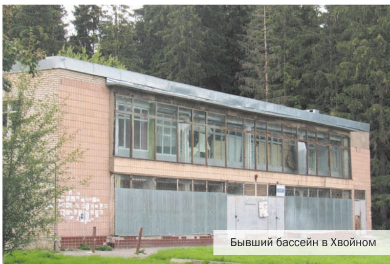
Бывший бассейн в Хвойном

Проходят годы, меняется власть, а мрачные архитектурные пейзажи вокруг нас вот уже много десятков лет остаются неизменными. В наших краях, куда ни глянешь, всюду натываешься на руины и мёртвые здания, из которых когда-то ушла жизнь, и никто не может вдохнуть в них новую. Это всё о Красном Селе и Горелово, изобилующими заброшенными строениями.