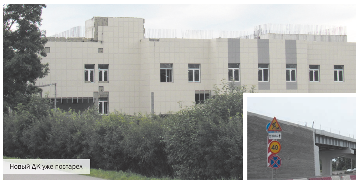
Новый ДК уже постарел