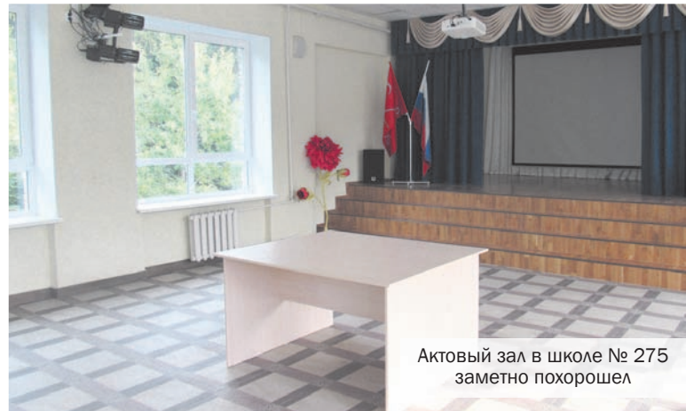
Актовый зал в школе № 275 заметно похоршел

В предыдущем номере Местной газеты №14 (101) от 20 августа 2019 г. была опубликована статья «Ремонт во время учёбы», где мы пишем о выделенных 275-й школе в Хвойном 13,5 млн. руб. на капитальный ремонт и благоустройство двора. Однако не всё так просто.