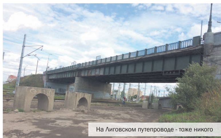
На Лиговском путепроводе - тоже никого