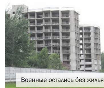
Военные остались без жилья