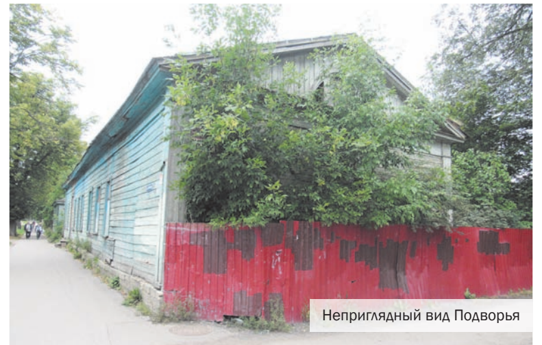
Неприглядный вид Подворья