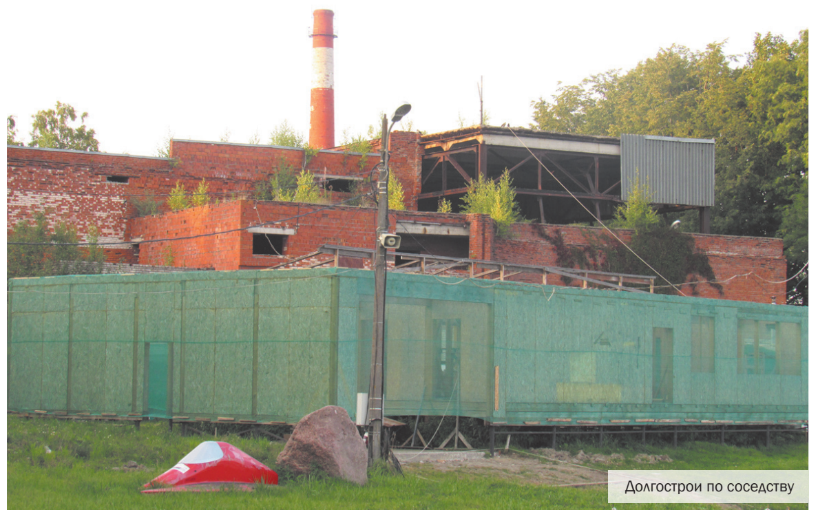
Долгострой по соседству

Причём советских долгостроев всё же поменьше. Самым заметным среди них можно считать кирпичное сооружение на берегу озера Безымянного. Здание, по информации Комитета имущественных отношений, на балансе города не числится, так что как бы само по себе. А рядом с ним на территории спасательной станции СПС-26 с некоторыми пор появился ещё один долгострой – новое здание для спасателей. Трудно назвать это строительством, уж слишком маленький объект, который начали устанавливать аккуратно после