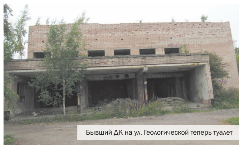
Бывший ДК на ул. Геологической теперь туалет