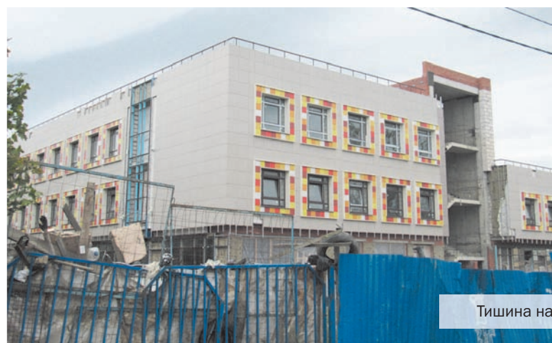
Тишина на поликлиниках