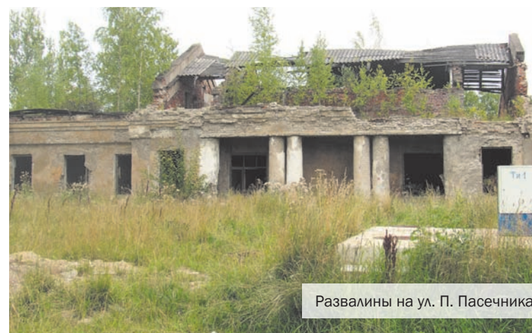
Развалины на ул. П. Пасечника