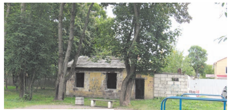
Бывшую мастерскую ни снести, ни отремонтировать

Проходят годы, меняется власть, а мрачные архитектурные пейзажи вокруг нас вот уже много десятков лет остаются неизменными. В наших краях, куда ни глянешь, всюду натываешься на руины и мёртвые здания, из которых когда-то ушла жизнь, и никто не может вдохнуть в них новую. Это всё о Красном Селе и Горелово, изобилующими заброшенными строениями.